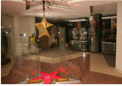
Музей Героев Советского Союза и России

117218, Москва, ул. Б. Черемушкинская, д. 24, корп. 3. Проезд до ст. метро «Академическая» тел. +7 (499) 744 3025